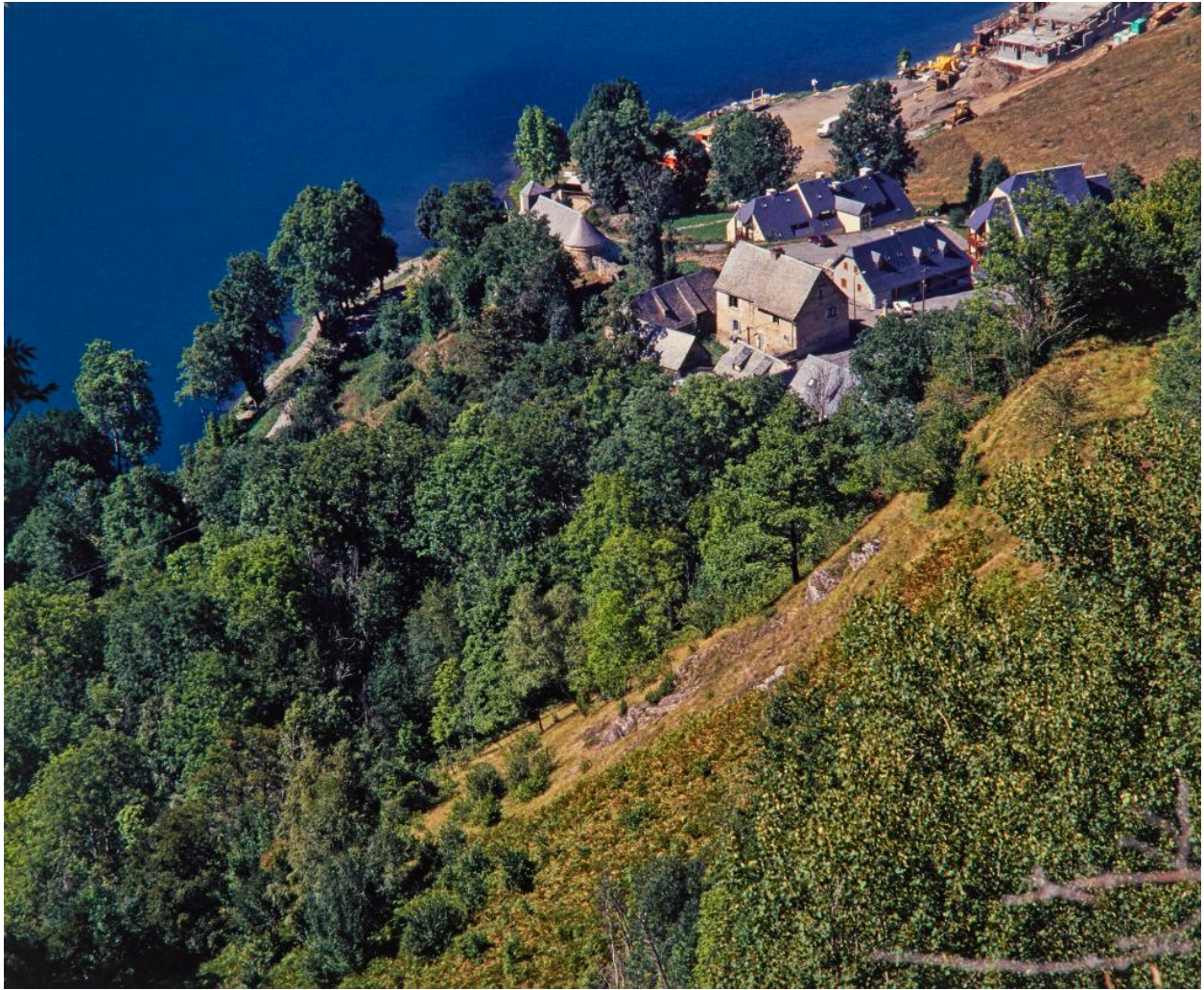
Paysage avec le village d'Aranvielle en contre-bas vu du sud-ouest.