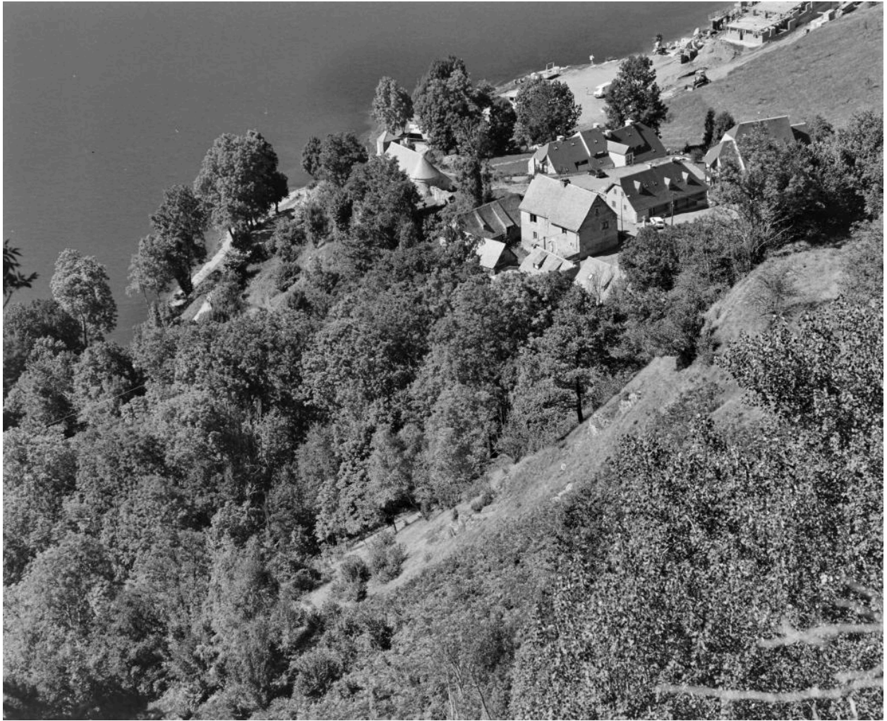
Paysage avec le village d'Aranvielle en contre-bas vu du sud-ouest.