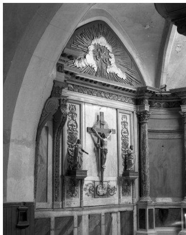
Chapelle de la Vierge : crucifixion. IVR91_19691101128X