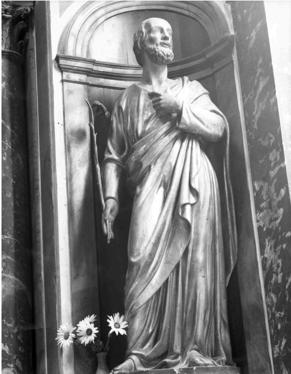
Statue de saint Joseph, vue générale.