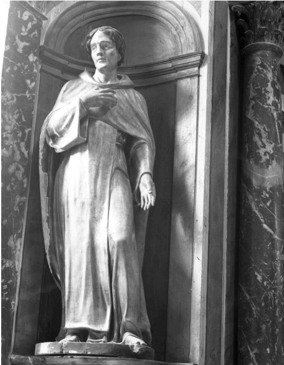
Statue de saint Dominique, vue générale.