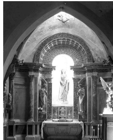
Chapelle de la Vierge : vue générale de l'autel.