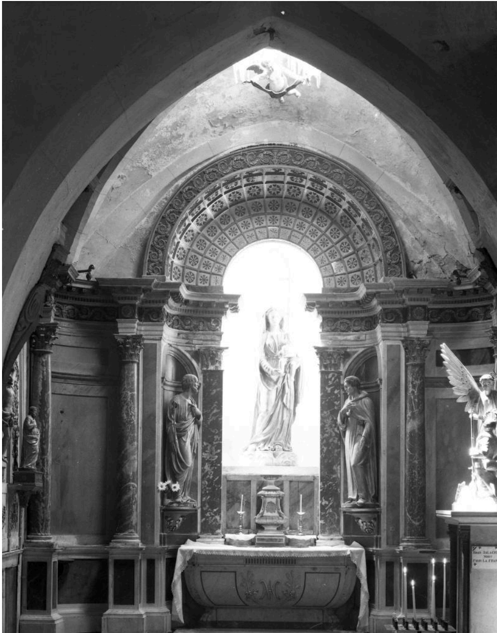
Chapelle de la Vierge : vue générale de l'autel.