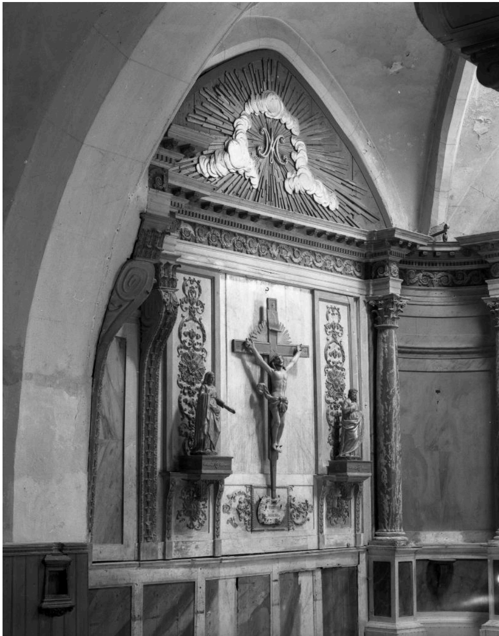
Chapelle de la Vierge : crucifixion.