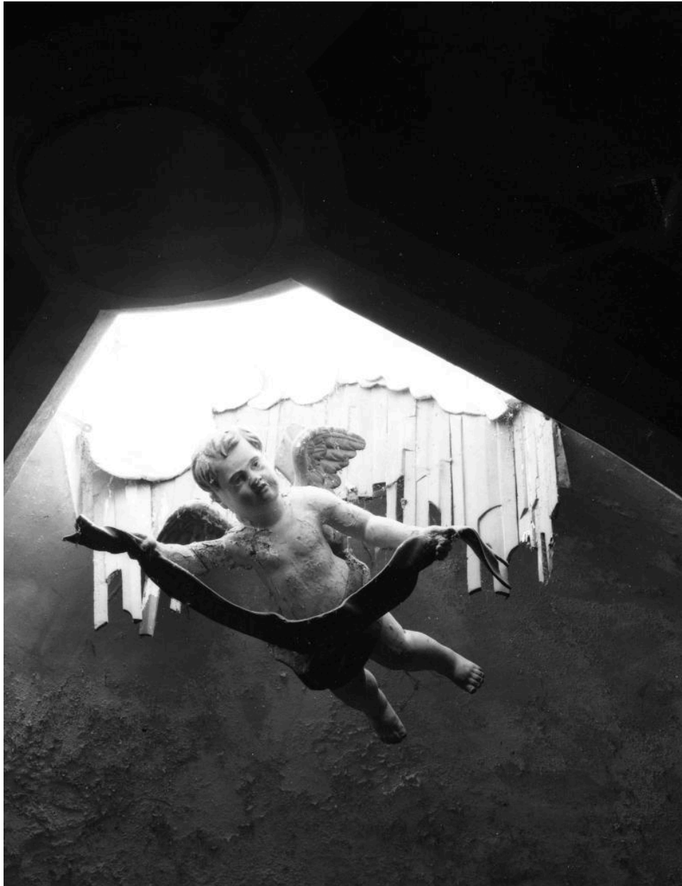
Chapelle de la Vierge : détail d'un angelot.