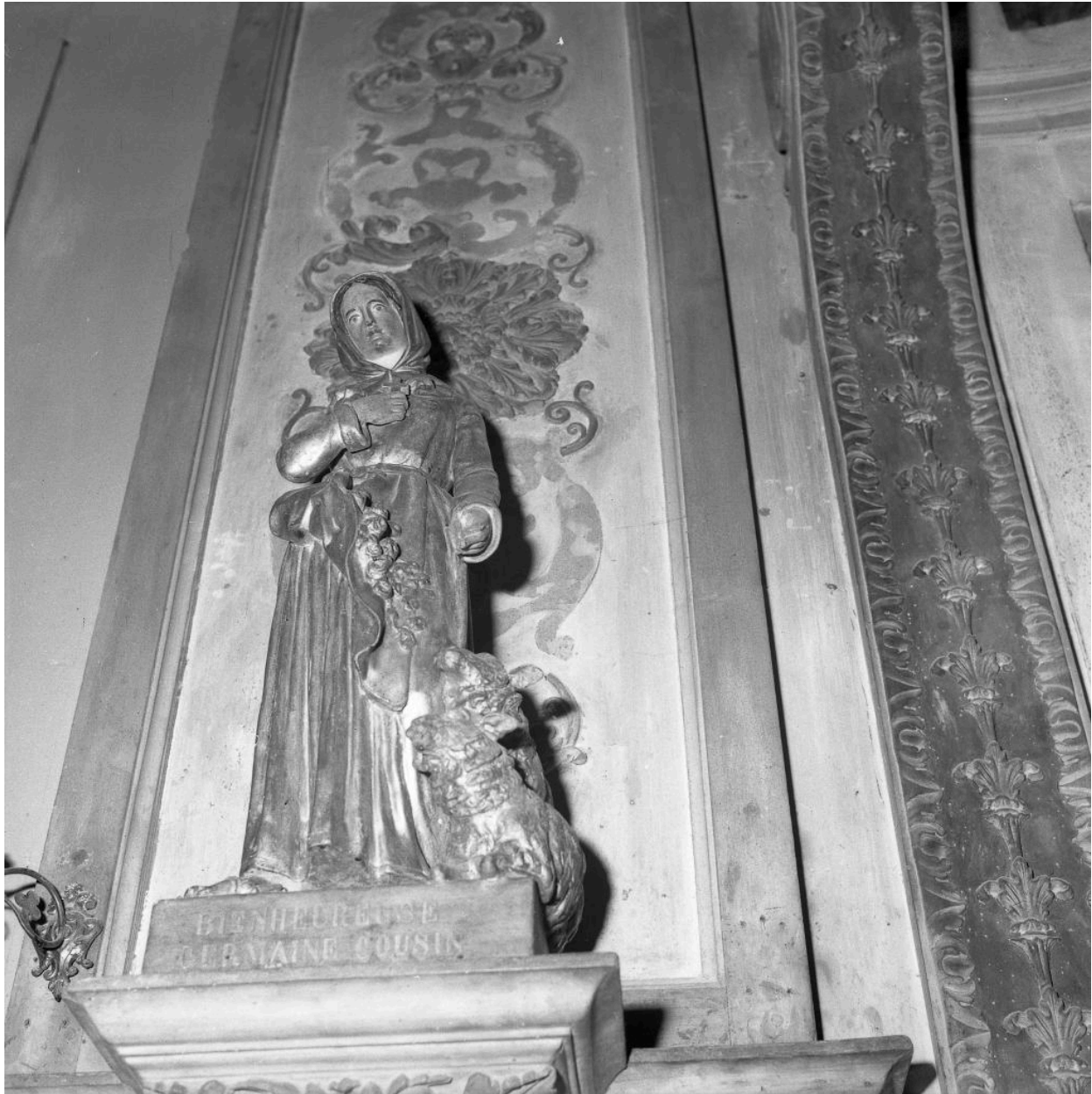
Statue de sainte Germaine.