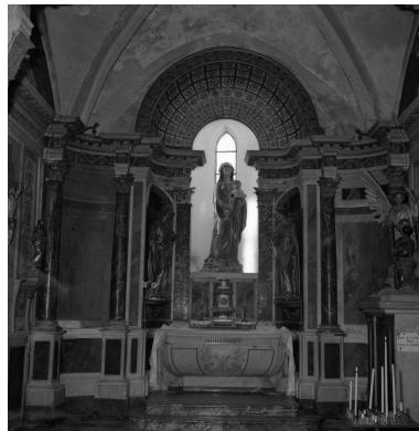
Chapelle de la Vierge : vue générale.