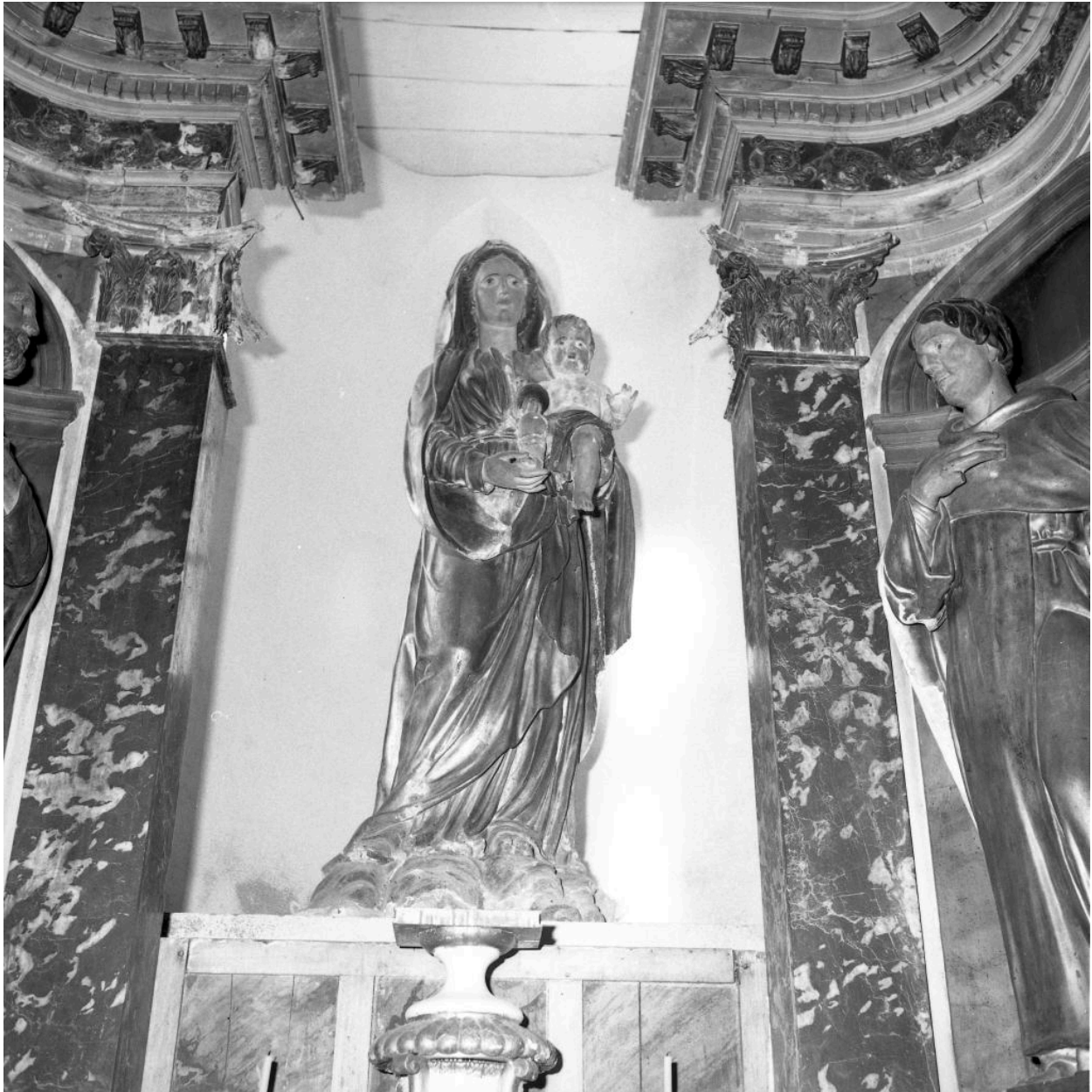
Chapelle de la Vierge : statue de la Vierge à l'Enfant.