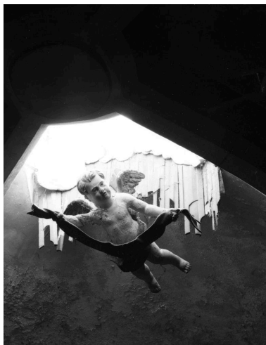
Chapelle de la Vierge : détail d'un angelot. IVR91_19691101131X