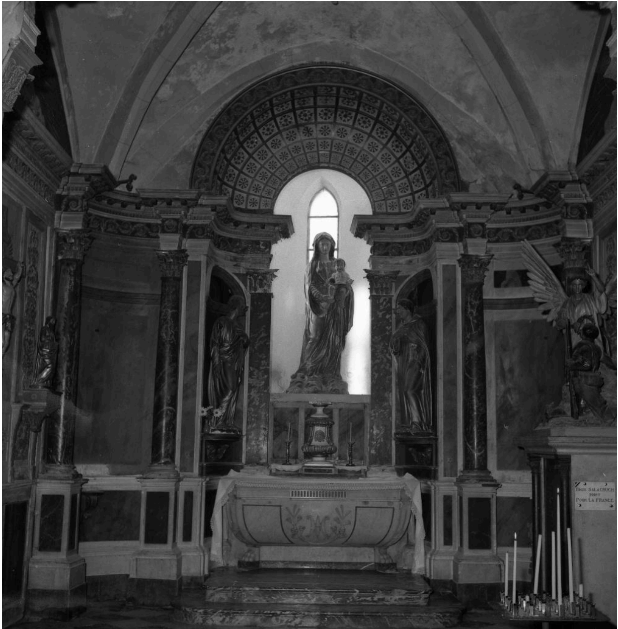
Chapelle de la Vierge : vue générale.