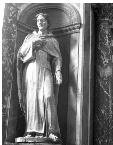
Statue de saint Dominique, vue générale. IVR91_19691101143X