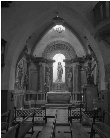
Chapelle de la Vierge : vue générale.