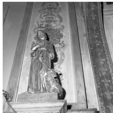
Statue de sainte Germaine.