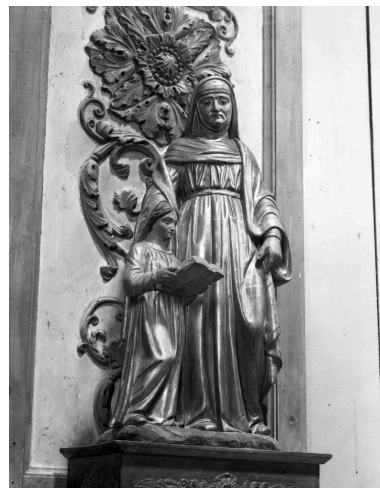
Statue de Saint-Anne dans la chapelle de la Vierge.