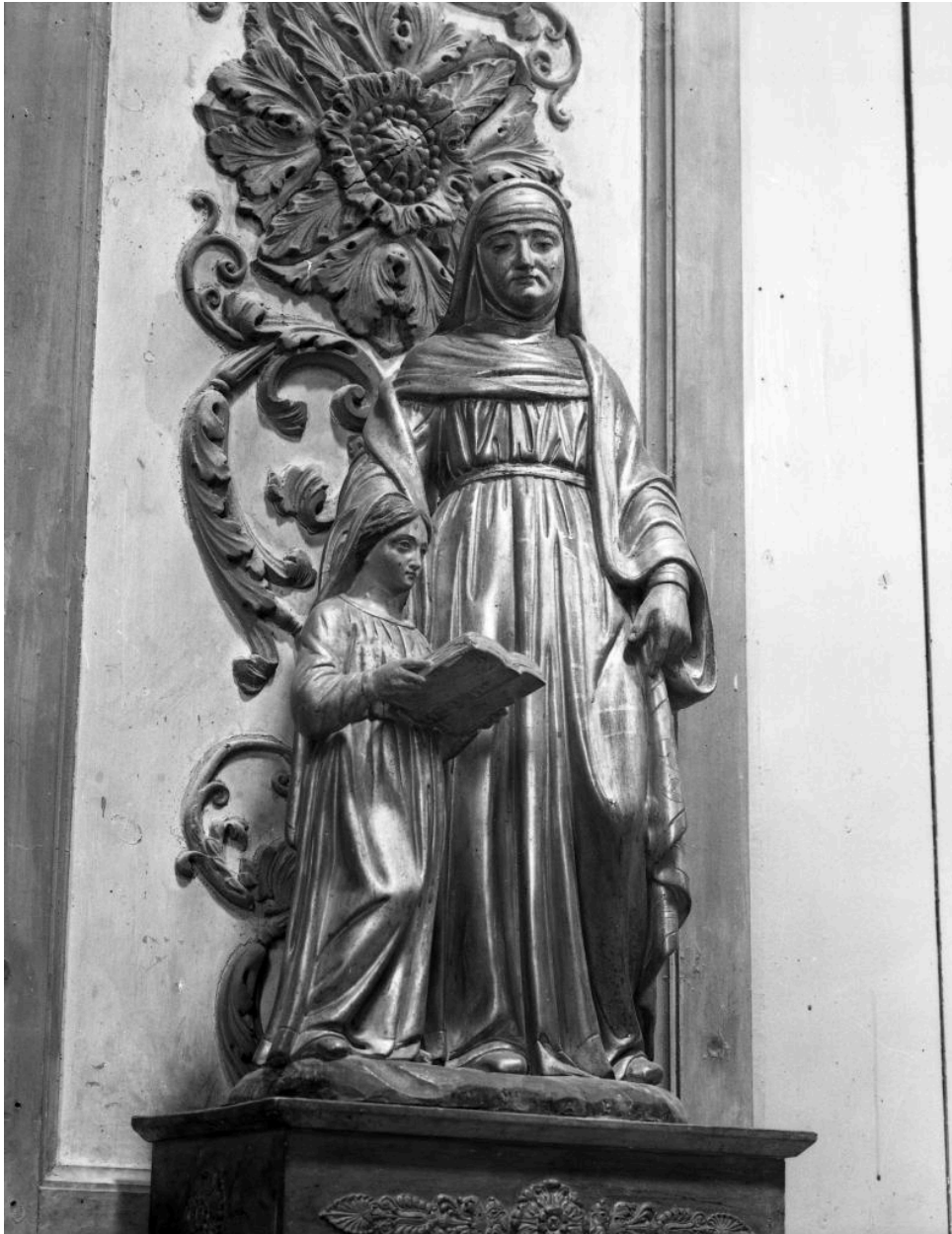
Statue de Saint-Anne dans la chapelle de la Vierge.