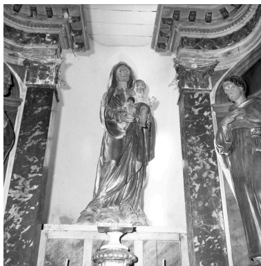
Chapelle de la Vierge : statue de la Vierge à l'Enfant. IVR91_19691101137X