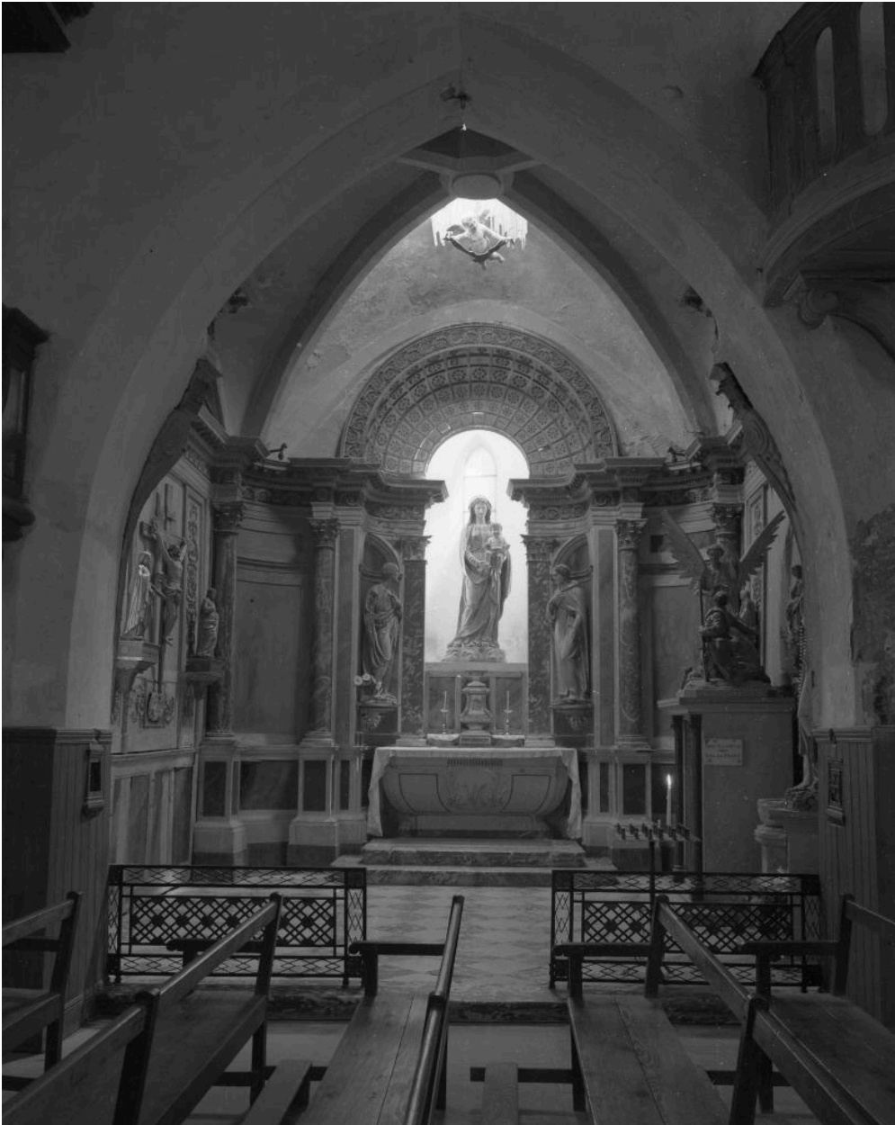
Chapelle de la Vierge : vue générale.