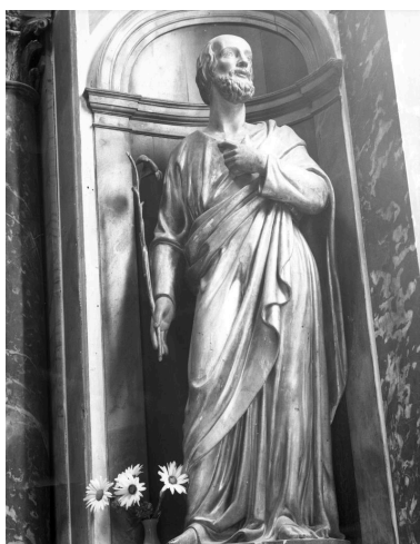
Statue de saint Joseph, vue générale.