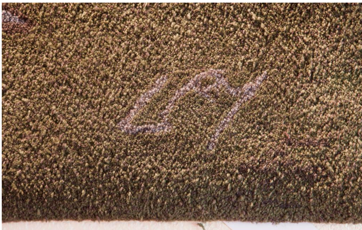
Détail de la signature.