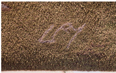
Détail de la signature. IVR73_20116553653NUCA