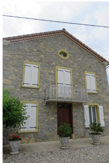
Elévation est. IVC09160_20180900999NUCA