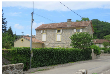
Elévation sud. IVC09160_20180900998NUCA