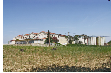
Vue éloignée IVR91_20086600283NUC2A