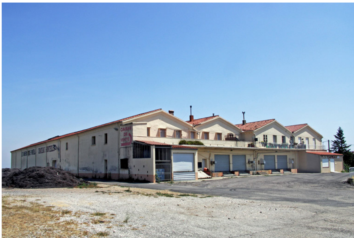
Vue d'ensemble de l'élévation principale.