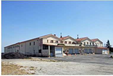
Vue d'ensemble de l'élévation principale. IVR91_20086600282NUC2A