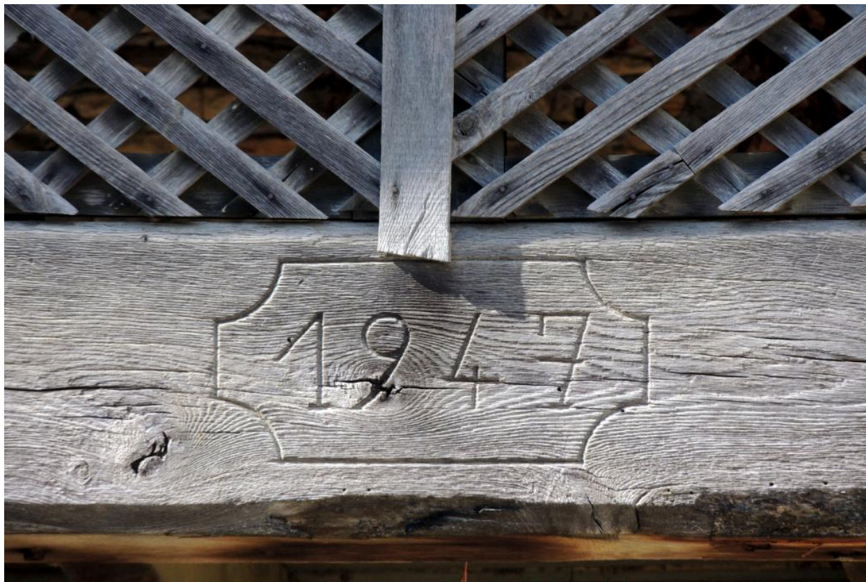
Détail du linteau daté du fenil (1947).