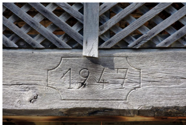
Détail du linteau daté du fenil (1947). IVD65_20146500493NUCA