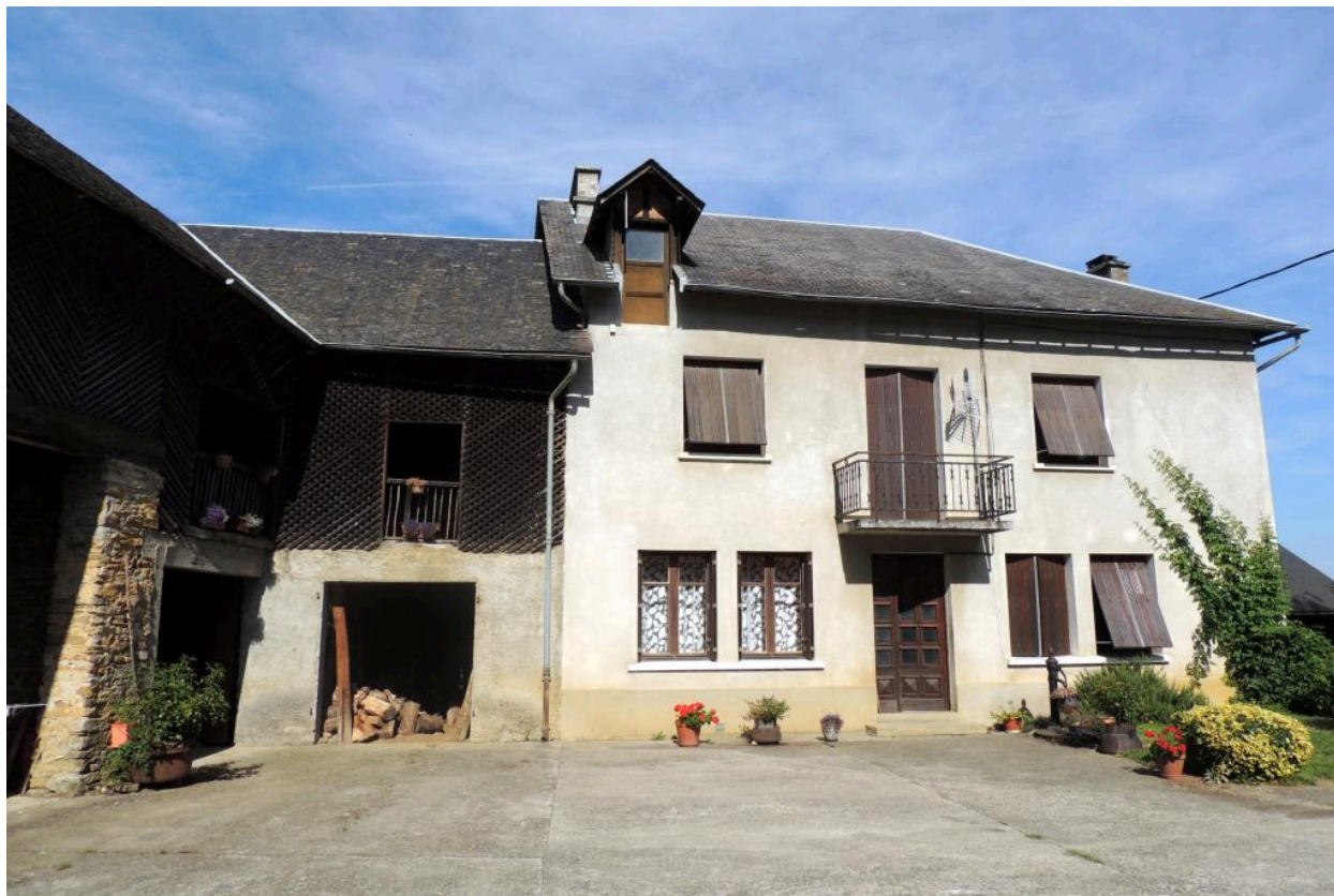
Vue du logis depuis l'est.