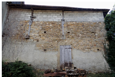
Vue de l'élévation ouest d'une partie des dépendances. IVD65_20146500495NUCA