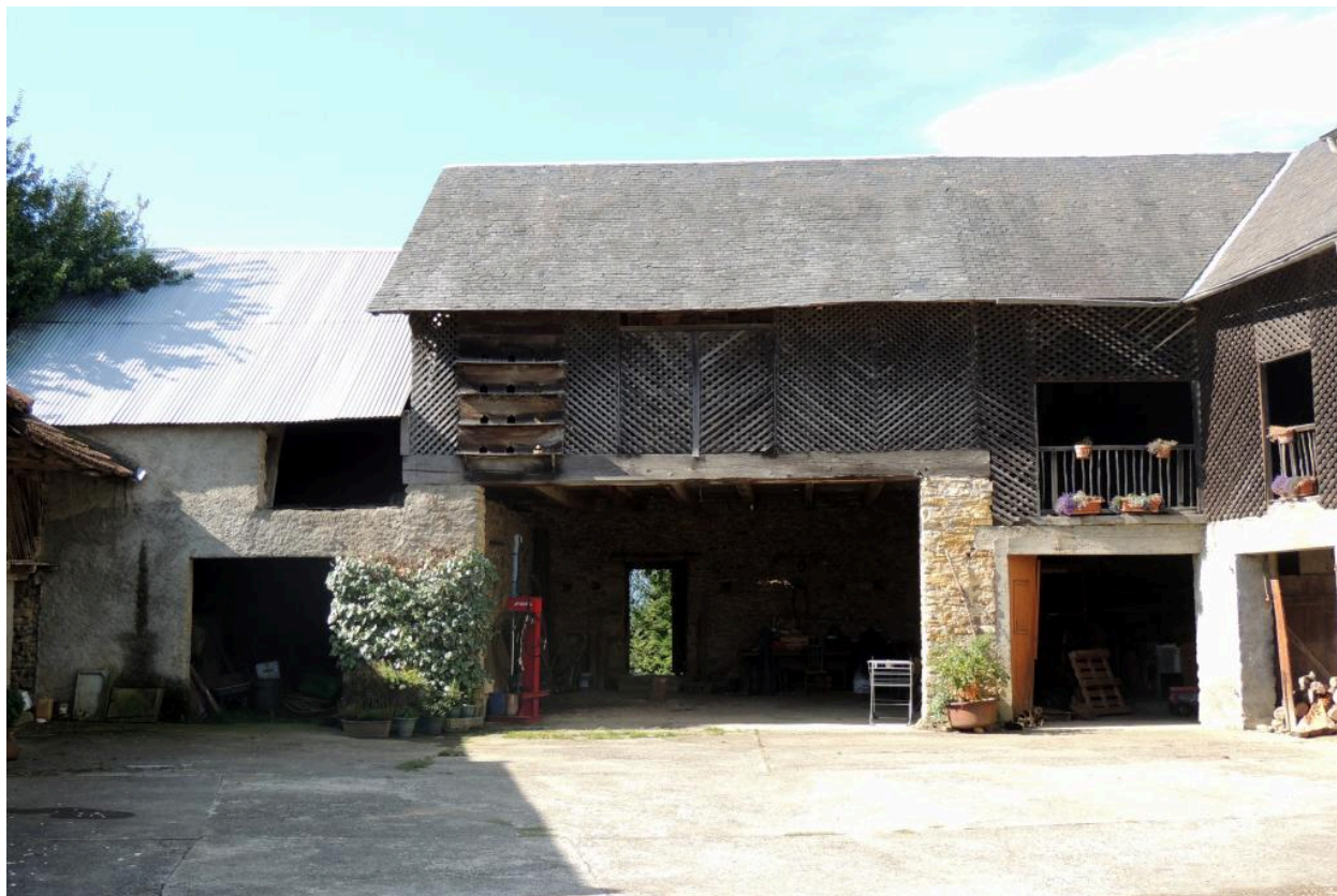
Vue des dépendances vers le sud.