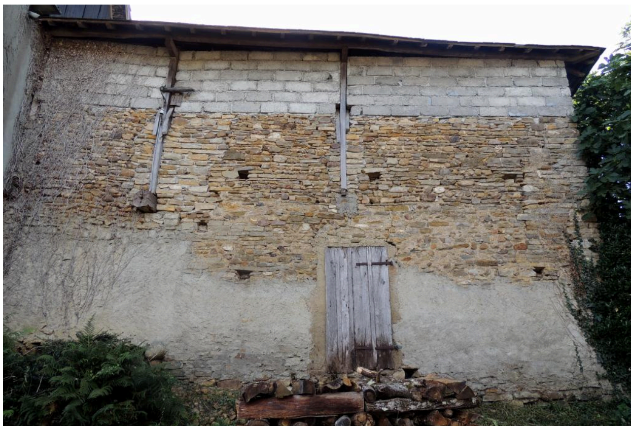
Vue de l'élévation ouest d'une partie des dépendances.