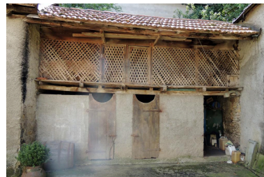
Poulailler-porcherie. IVD65_20146500494NUCA