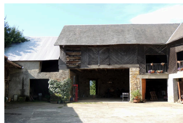
Vue des dépendances vers le sud. IVD65_20146500492NUCA