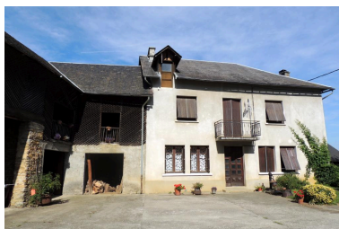
Vue du logis depuis l'est. IVD65_20146500491NUCA