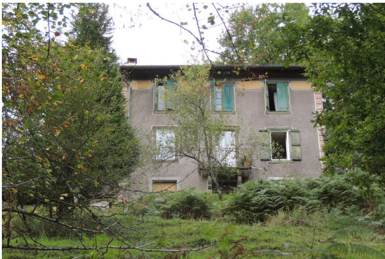
Vue de l'élévation principale depuis le nord.