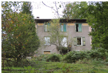
Vue de l'élévation principale depuis le nord. IVD65_20146500386NUCA