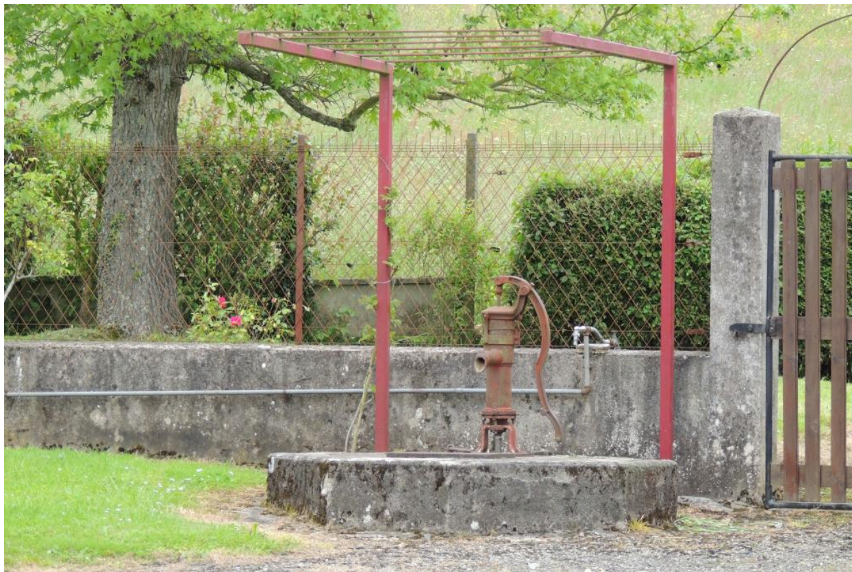
Détail du puits.