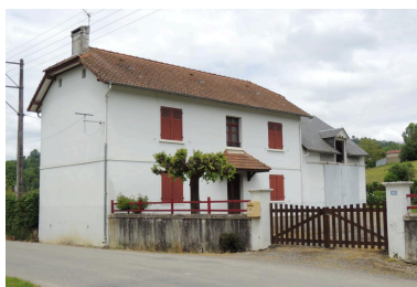
Vue de l'élévation sud. IVD65_20136500228NUCA