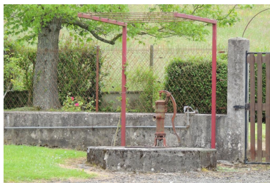
Détail du puits. IVD65_20136500231NUCA