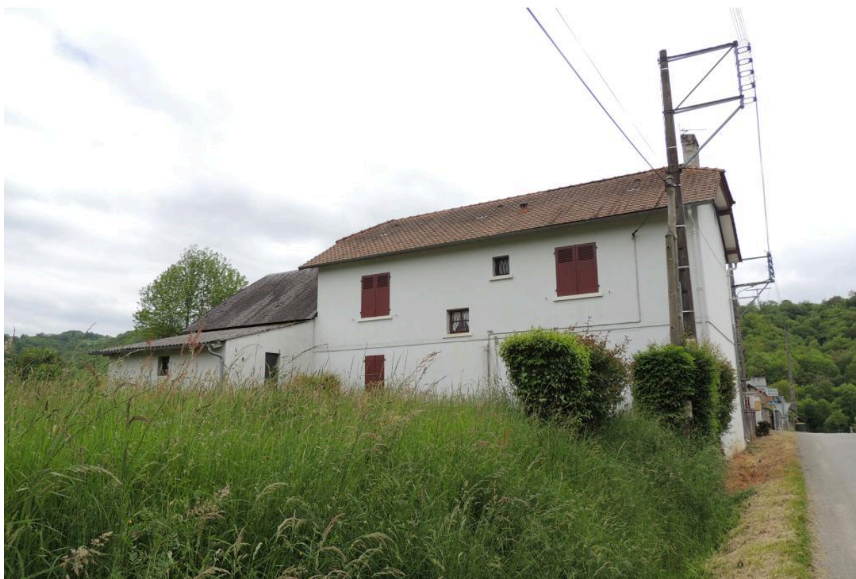
Vue de l'élévation nord.