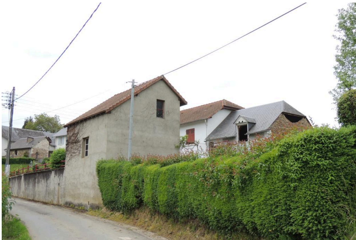
Vue depuis le sud-est.