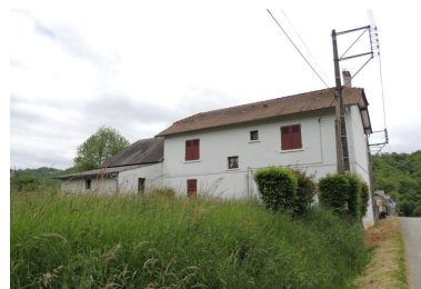
Vue de l'élévation nord. IVD65_20136500229NUCA