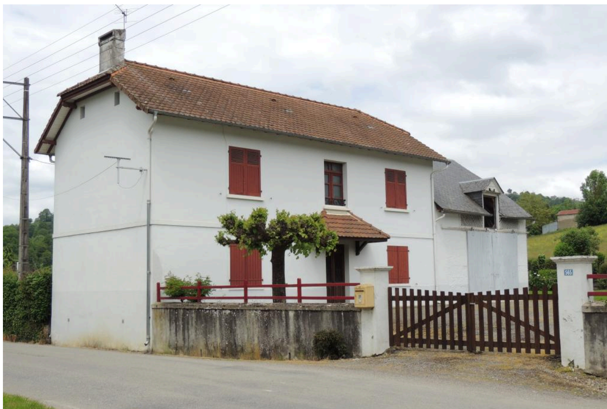
Vue de l'élévation sud.