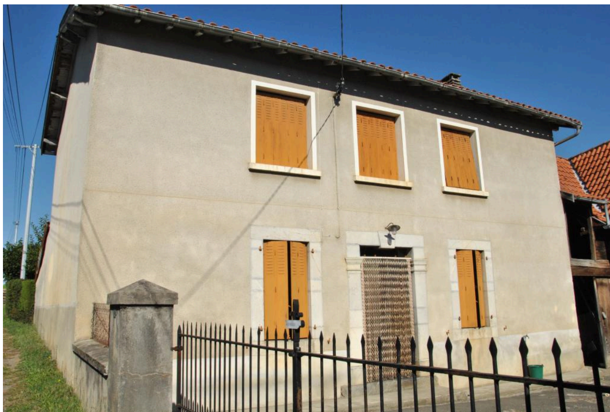
Vue de l'élévation principale depuis l'est.