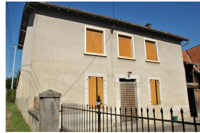
Vue de l'élévation principale depuis l'est. IVD65_20146500402NUCA