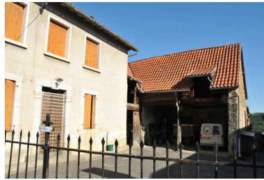
Vue des anciennes dépendances. IVD65_20146500403NUCA