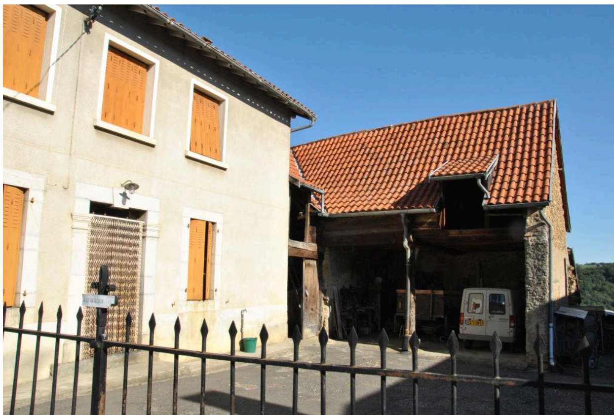
Vue des anciennes dépendances.