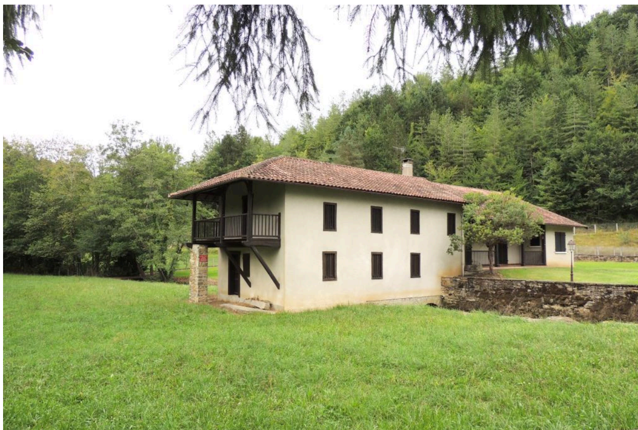
Vue du moulin depuis le sud-est.