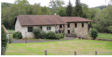
Vue de moulin depuis le nord-ouest.