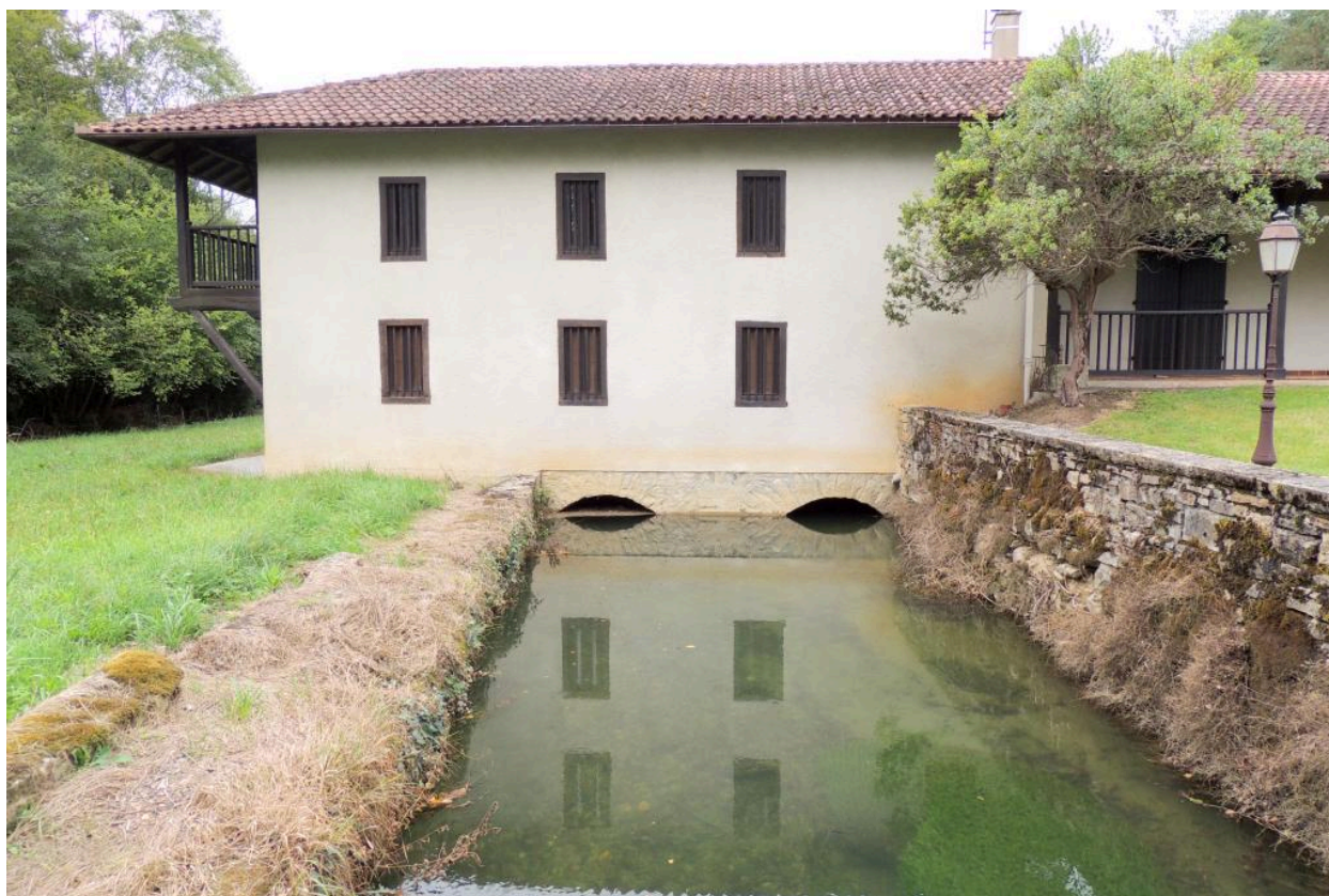
Vue du moulin depuis l'est.