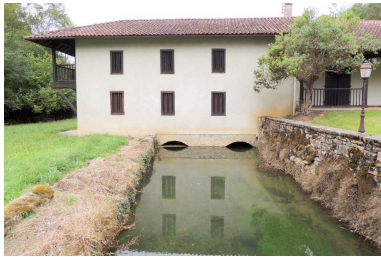
Vue du moulin depuis l'est. IVD65_20146500589NUCA