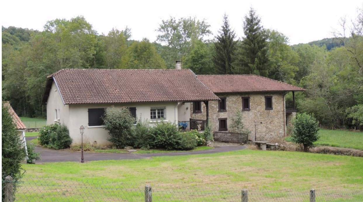
Vue de moulin depuis le nord-ouest.