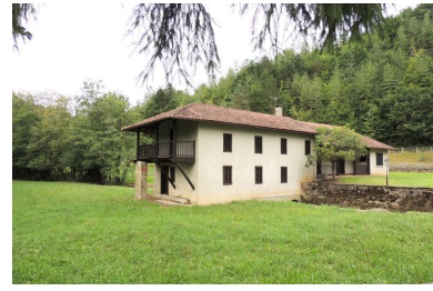
Vue du moulin depuis le sud-est. IVD65_20146500588NUCA