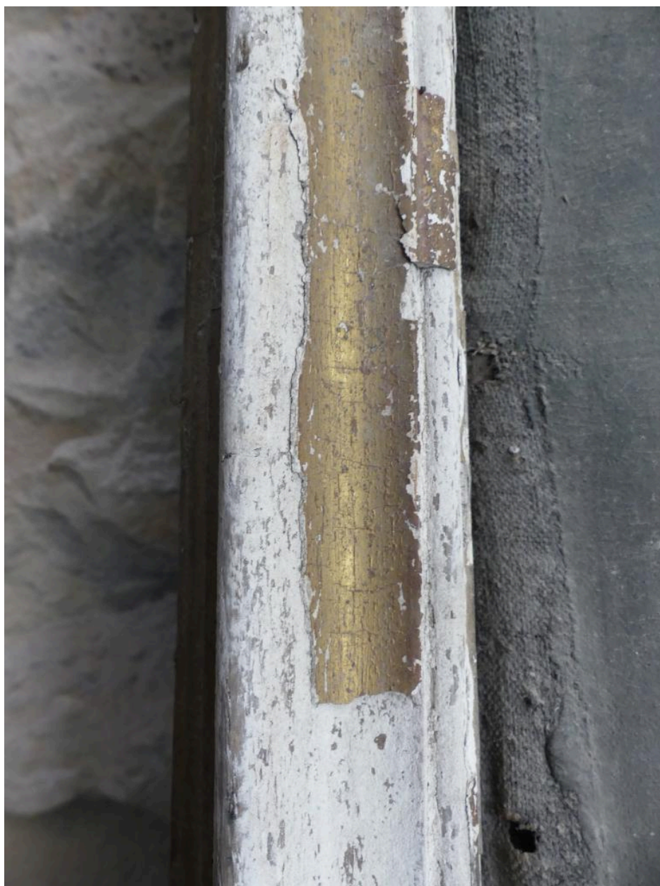
Détail du cadre.