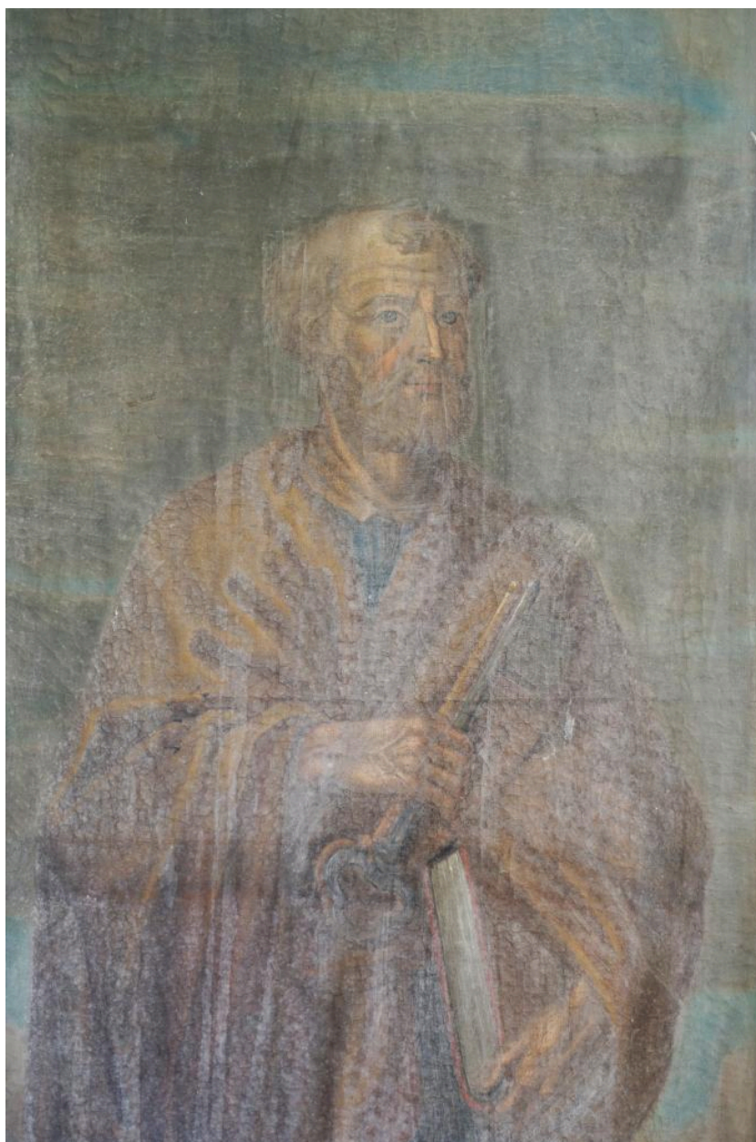
Détail : saint Pierre.