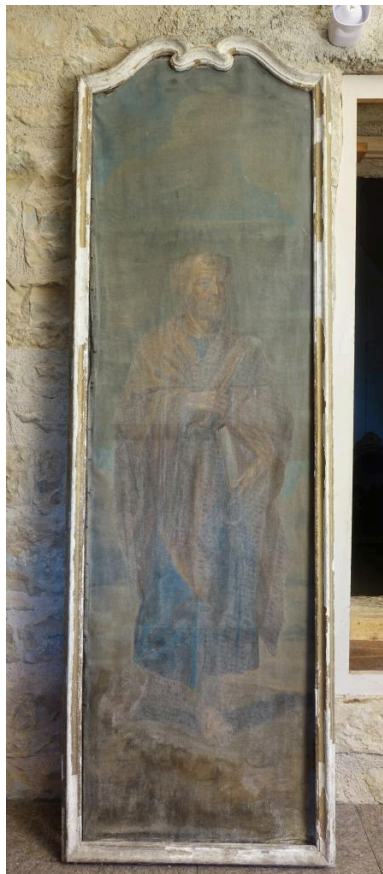
Vue générale. IVD46_20224606242NUCA