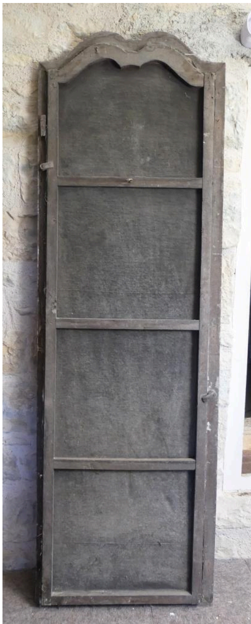
Vue générale du revers.