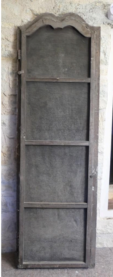
Vue générale du revers. IVD46_20224606270NUCA