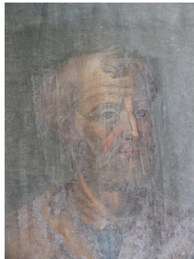
Détail de la tête de saint Pierre.