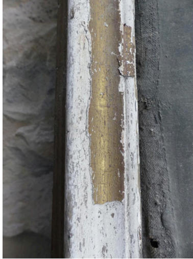
Détail du cadre. IVD46_20224606269NUCA