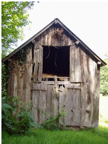
Vue de l'élévation est de la grange.