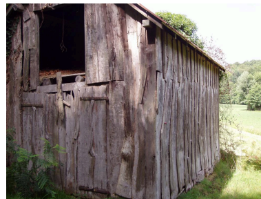
Vue de l'élévation est de la grange.