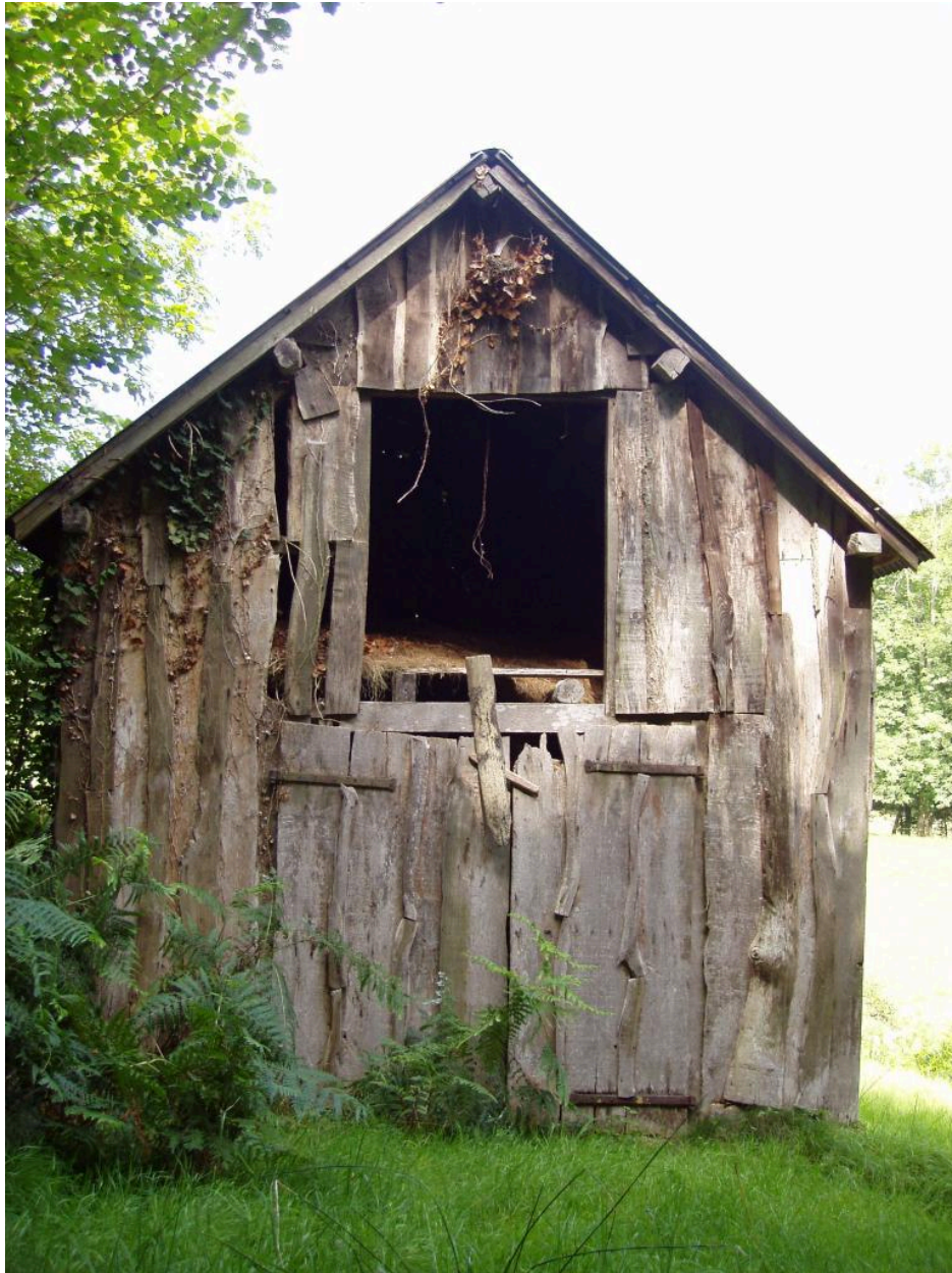
Vue de l'élévation est de la grange.