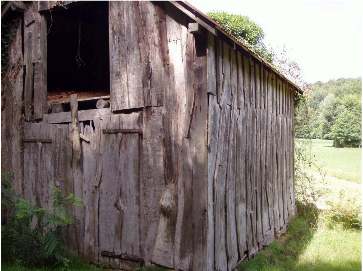
Vue de l'élévation est de la grange.